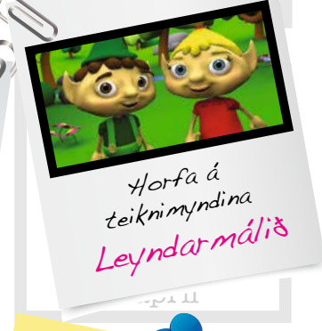
Horfa á teiknimyndina Leyndarmálið

MUNA! Þann 24. apríl er ókeypis fyrirlestur á netinu fyrir foreldra kl. 20:00. Skráning á blattafram@blattafram.is