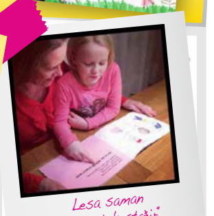
Lesu saman „Mínir einkastaðir“

Ræddu málin! Börn halda ofbeldinu oft leyndu. Með því að tala opinlegt um málefnið er hægt að rjúfa þögnina. 7 skref til verndar börnum*