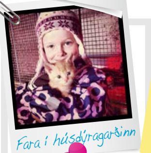
Fara í húsdýragarðinn

Fækkaðu tækifærunum! Fækka kringumstæðum þar sem barn er eitt með einum fullorðnum. 7 skref til verndar börnum*