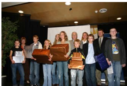
Verðlaunahafarnir ásamt Þorgerði Katrínu Gunnarsdóttur menntamálaráðherra, Árna M. Mathiesen sjávarútvegsráðherra og Björgólfi Guðmundssyni formanni bankaráðs Landsbankans

Níu skólar tóku þátt í keppninni og var skipuð sérstök dómnefnd til að velja verðlaunaverkefni en veitt voru þrenn glæsileg verðlaun. Nefndin var skipuð einum fulltrúa sjávarútvegsráðuneytis, einum fulltrúa menntamálaráðuneytis og