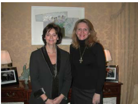
Cherie Booth Blair og Þorgerður Katrín Gunnarsdóttir

meta hvernig þetta nýtist og hvað hægt er að gera betur því svona mælikvarðar eru ekki einhlítir.