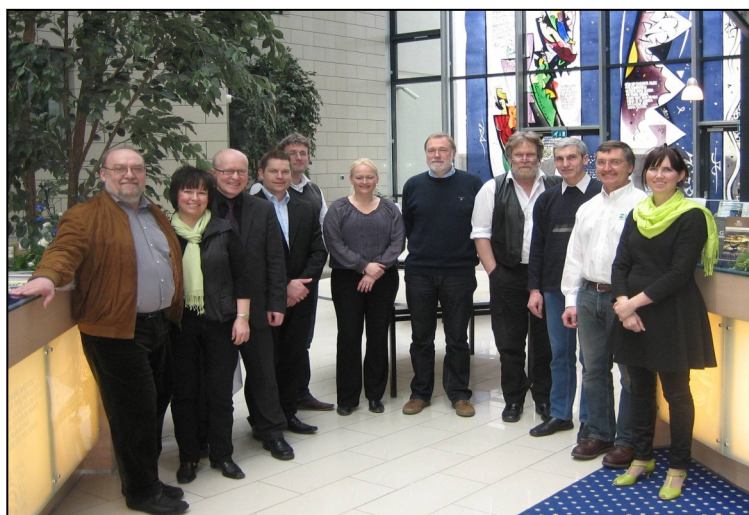
Fulltrúar níu landa ásamt fulltrúa Norðurskautsráðsins mættu til fundarins

forstjóri Landmælinga Íslands kjörinn formaður stjórnar verkefnisins næstu tvö árin en hann situr þar sem fulltrúi allra norrænu kortastofnana.