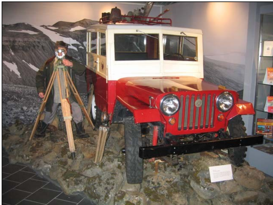
Teddi á góðri stundu

Þjóðminjasafn Íslands að frágangi munanna sem voru á sýningunni. Mikill áhugi er hjá Landmælingum Íslands á því að varðveita þessa gömlu muni og í apríl síðastliðnum gerði stofnunin samkomu-lag við Skógasafn um varðveislu og eign hluta munanna um ókomna tíð. Starfsmenn Skógasafns hafa nú fengið þessa muni afhenta en stærsti gripurinn sem fór til varðveislu á safninu er Willys jeppi, árgerð 1946, sem keyptur var af Landmælingum Íslands í kringum árið 1995 og var endurgerður til að líkjast þeim jeppum sem notaðir voru í mælingaleiðöngum á síðustu öld. Af öðrum munum sem afhentir voru má m.a. nefna vaxmyndadúkkuna Tedda og bakpokann hans, hornamælitæki og þrífót, myndir af landmælingamönnum og veggspjald frá sýningunni „Í rétta átt“. Starfsmenn Landmælinga Íslands eru Skógasafni afar þakklátir fyrir að gefa þessum gömlu munum áframhaldandi líf með því að leyfa gestum og gangandi að skoða þá og fræðast um landmælingar og kortagerð fyrri tíma.