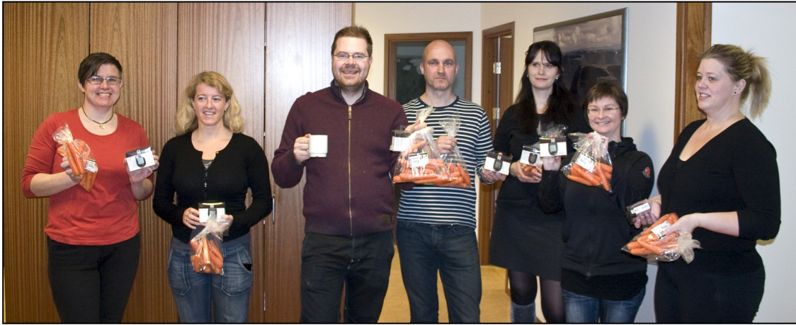
Glaðir sigurvegarar í „Hjólað í vinnuna“ hlutu að launum hraðamæli á hjól