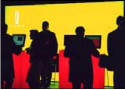
Stemningin var dulúðug og spennandi