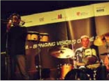
Hljómsveitin Jagúar tróð upp á föstudagskvöldinu og spilaði af snillið við mikinn fögnuð unga fólksins