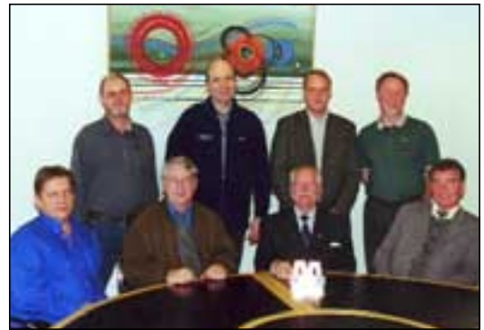
Stjórn Málmis ásamt heiðursfélaganum Björgvini