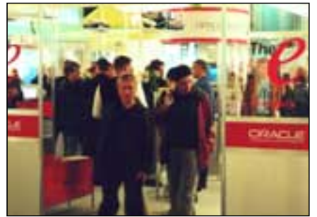
Oft var þröngt á þingi í básum sýnenda

eins og WAP, GPRS, IP o.s.frv. heldur aðeins að notendavæn þjónusta skipti höfuðmáli.