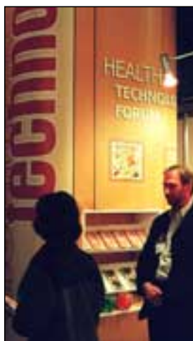
Kristins og sagði það hefði sýnt sig að mörg bestu og framsæknustu fyrirtæki heims töluðu aldrei um tæknistaðla