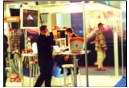
Fjarskiptafyrirtækin kepptust um athygli gesta