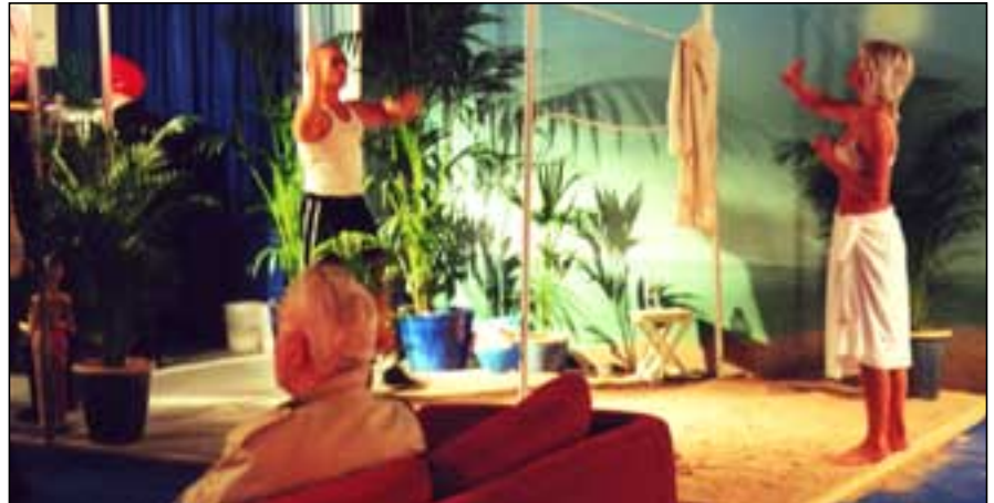
Andrúmsloftið var afslappað og suðrænt í hitabeltisbás fyrirtækisins i7