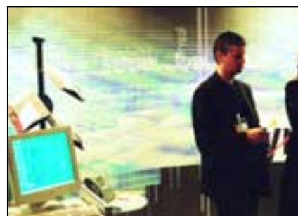
Skyldu þeir vera að ræða um öryggi í gagnaflutningum? Skýrr hf. kynnti nýja þjónustu; Kerfisleigu