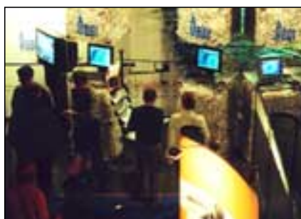
Bekking og ráðgjöf lykilatriði í framtíðinni; Oddi hf. prentsmiðja