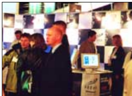
Kynning sýnenda var fagleg og gagnvirk fyrir iðnaðinn