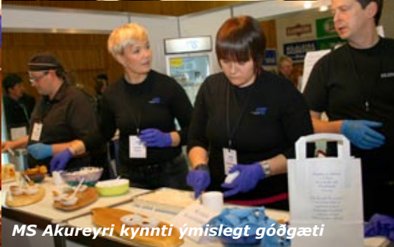
MS Akureyri kynnti ýmislegt góðgæti