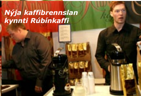
Nýja kaffibrennslan kynnti Rúbínkaffi