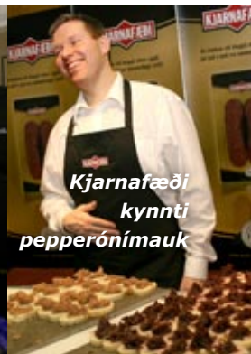
Kjarnafæði kynnti pepperónimauk