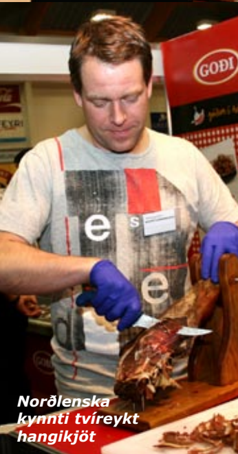
Norðlenska kynnti tvíreykt hangikjöt