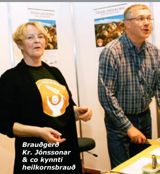
Brauðgerð Kr. Jónssonar & co kynnti heilkornsbrauð

Sýningin MATUR-Inn var haldin í Íþróttahöllinni á Akureyri fyrstu helgina í október. Aðalmarkmið sýningarinnar er að kynna norðlenskan mat og matarmenningu. Á fjórða tug fyrirtækja kynntu starfsemi sína, jafnt stórir sem smáir matvælaframleiðendur og fyrirtæki í veitingastarfsemi. Félagmenn SI voru í stóru hlutverki á sýningunni, þ.á.m. Norðlenska matborðið, Kjarnafæði, MS Akureyri, Brauðgerð Kr. Jónssonar & co kynnti heilkornsbrauð úti fyrir sýningarhöllinni og laðaði gesti að en talið er að hátt í 15.000 manns hafi sótt sýninguna heim þessa tvo daga. Að sýningunni standa félagið Matur úr Eyjafirði, Matarkistan Skagafjörður og Þingeyska matarbúrið. Auk þeirra koma ýmsir styrktaraðilar að verkefninu s.s. sjávarútvegs- og landbúnaðarráðuneytið, Samtök iðnaðarins, búnaðarfélag og búgreinasamtök. Við lok sýningarinnar voru veitt frumkvöðlaverðlaun félagsins Matur úr Eyjafirði. MS Akureyri hlaut verðlaunin fyrir vörubrúun, markaðsstarf og nýsköpun í hollustuvörum úr osta- og skyrmysu. Samtök iðnaðarins óska starfsfólki MS Akureyri hjartanlega til hamingju með viðurkenninguna.