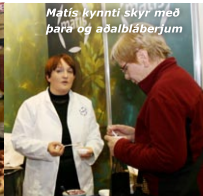
Matís kynnti skyr með para og aðalbláberjum