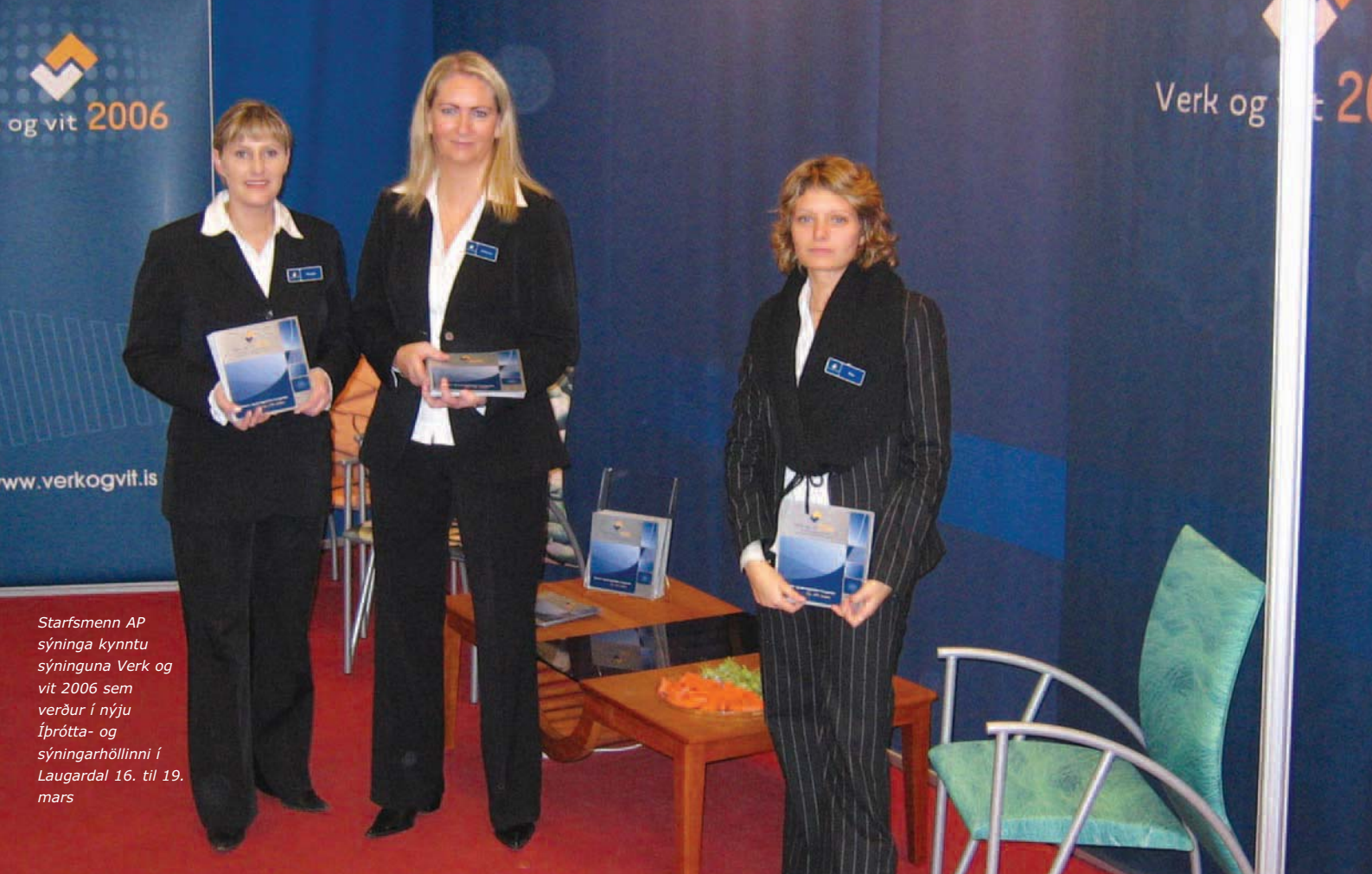
Starfsmenn AP sýninga kynntu sýninguna Verk og vit 2006 sem verður í nýju Íþrótt- og sýningarhöllinni í Laugardal 16. til 19. mars