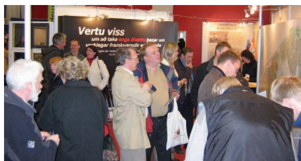
Bæjarstjóri Hafnarfjarðar tók vel á móti gestum og skeggræddi málin