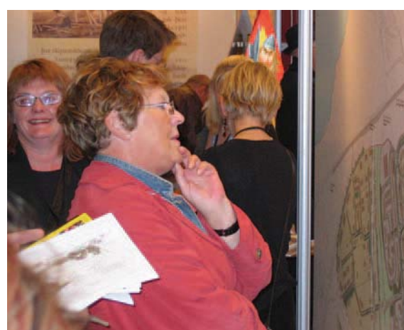
Íbygginn gestur kynnrir sér nýtt deiliskipulag á Ásvöllum