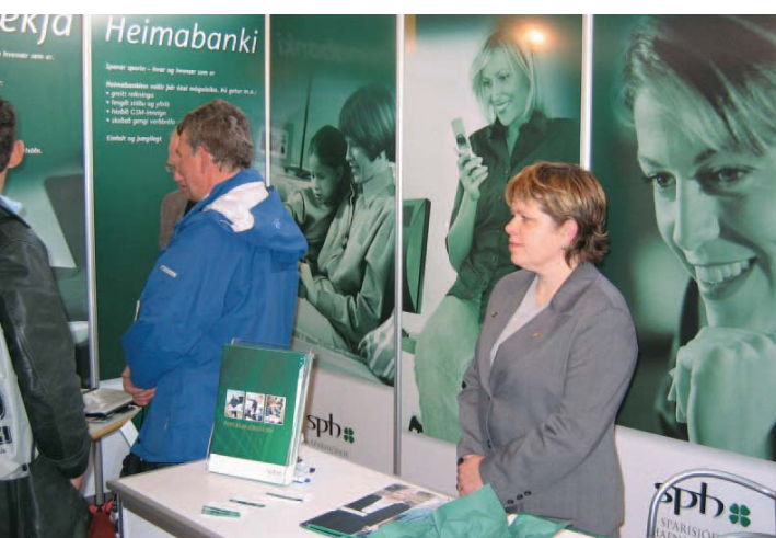
Bás Sparisjóðs Hafnarfjarðar