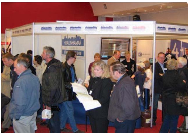
Hamagangur hjá fasteignasöluinni Hraunhamri