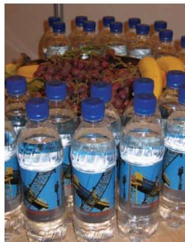
Stórsnjöll hugmynd! Byggingakranavatn í boði Landsbanka Íslands