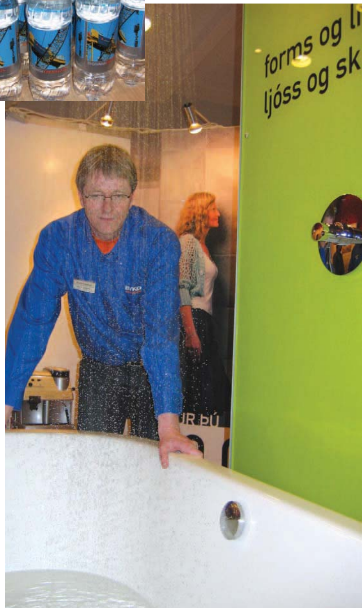
Starfsmaður Byko lagði hausinn í bleyti!