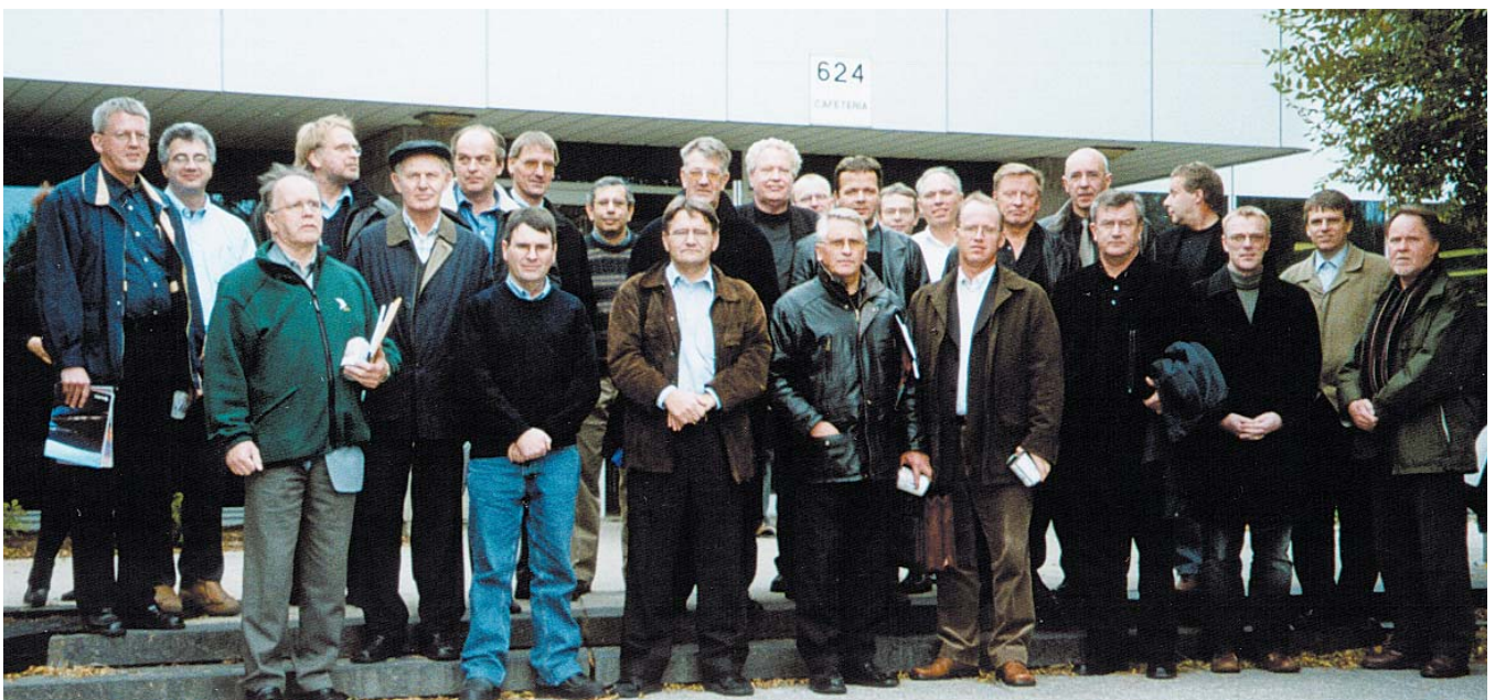
Fríður hópur ferðalanga á slóðum Vestur-Íslendinga