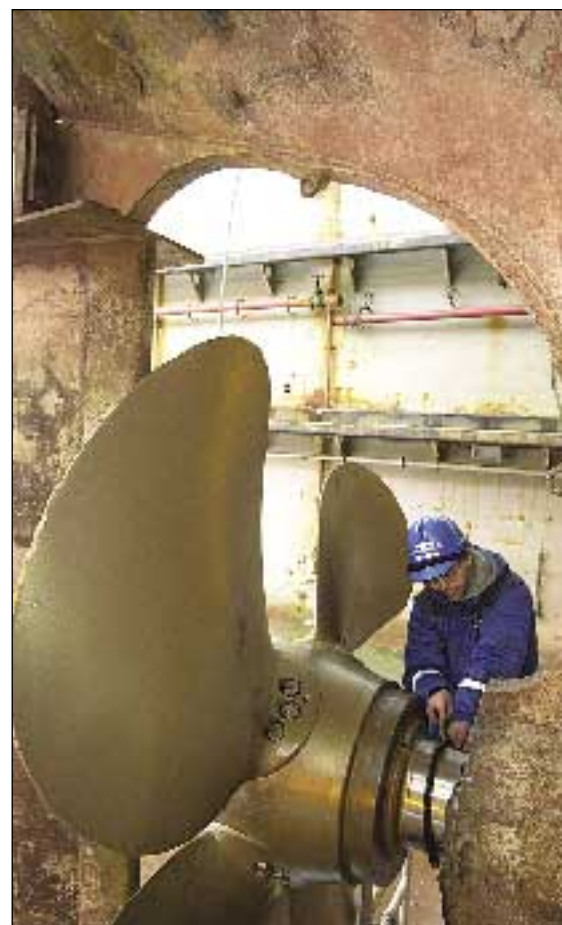
Vinna við skrúfuþétti