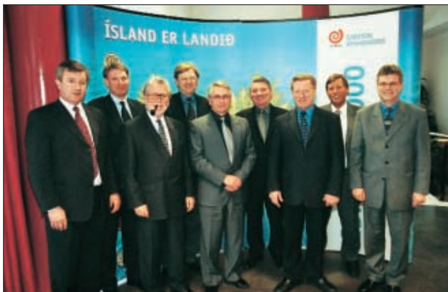
Framkvæmdastjóri og ný stjórn SI

Gildir atkvæðaseðlar til stjórnarkjörs Samtaka iðnaðarins á Iðnþingi voru 55.913. Greidd atkvæði reyndust 45.055 og kosningaþátttaka því 80,58%. Kosning er tvískipt, þ.e. annars vegar er formannskjör en hins vegar stjórnarkjör.