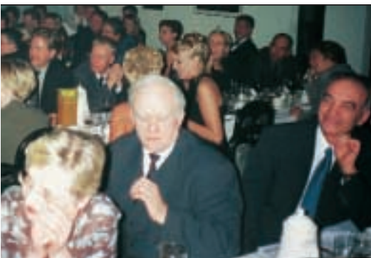
Menn skemmtu sér á árhátíð MiH