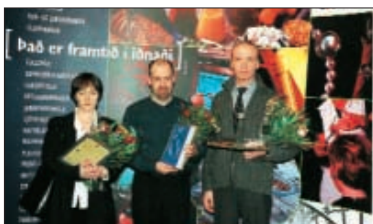
Helgarsteik frá SS hlaut 1. verðlaun.