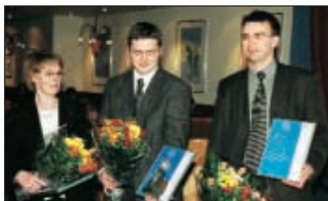
Heilsutvenna frá Lýsi hlaut 3. verðlaun.

Umbúðalína Össurar hf. hlaut 2. verðlaun.