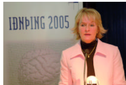
Valgerður Sverrisdóttir iðnaðarráðherra

Í þriðja lagi sé mikilvægt að frá upphafi sé nokkuð vel frá því gengið að trygg fjárfesting sé milli frumfjárfestinga og þeirra fjárfesta sem hafi markað sér fjárfestingarstefnu síðar