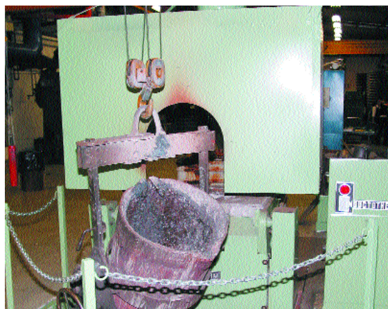
Járnsteypan á nýjum stað í húsnæði Héðins að Stórásí 6 í Garðabæ