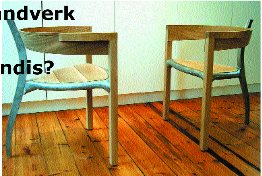
Borðstofustólar í víkingastíl