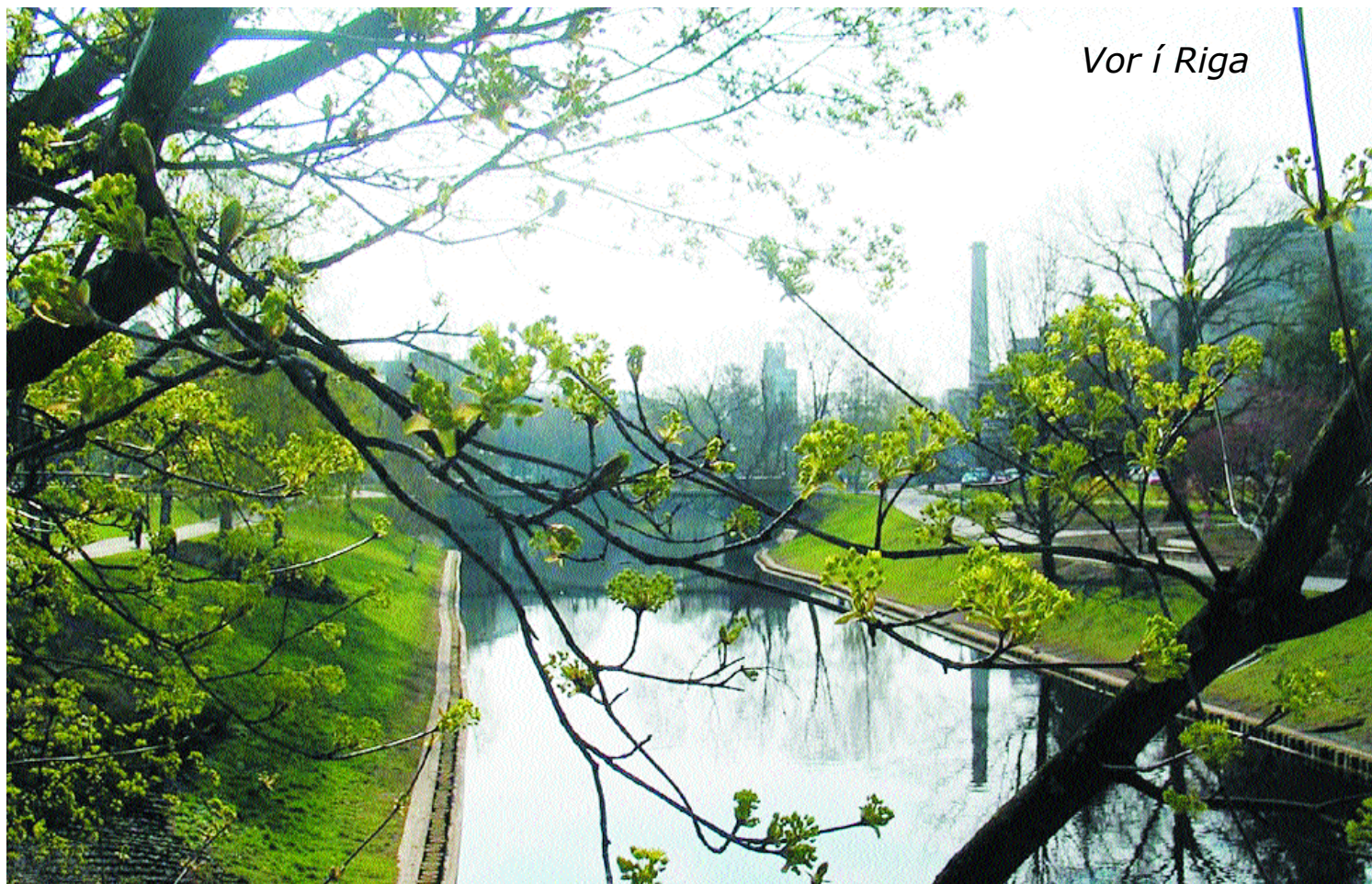
Vor í Riga