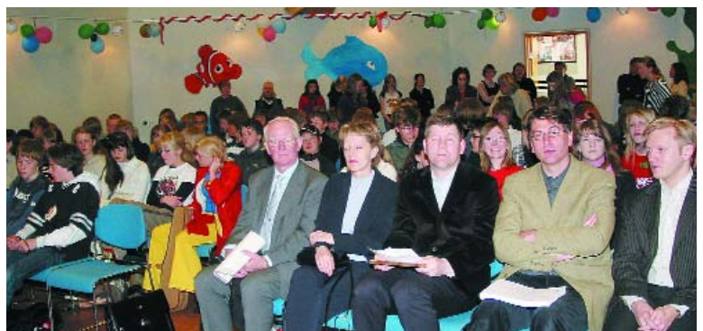
Frá athöfn í Hlíðaskóla