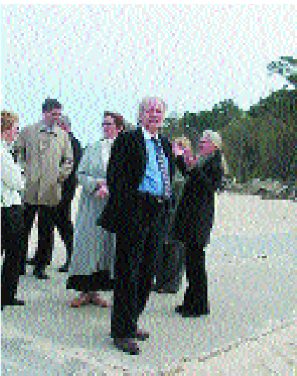
Málin rædd í Jurmala

Māris Gailis, fyrrverandi forsætisráðherra Lettlands, sat kvöldverðarboð með stjórninni, Jóni Baldvini og Bryndísi Schram. Þar flutti hann erindi um þróunina í Lettlandi. Gailis gegndi embætti frá 15. september 1994 - 21. desember 1995. Alls hafa 11 ríkisstjórnir setið frá því að sú fyrsta tók við völdum 7. maí 1990 og níu menn gegnt embætti forsætisráðherra. Meðal þess sem Gailis vakti athygli á var að nú er í rauninni búið að byggja upp nýtt þjóðríki frá grunni. Þegar Lettar öðluðust sjálfstæði og tóku málin í eigin hendur höfðu þeir ekkert til þess að byggja á. Ráðuneyti, stjórnýsly og stofnanir varð reisa frá grunni. Gailis sagði að þetta hefðu verið erfiðir en spennandi tímar, mörg mistök verið gerð en nú væri að komast stöðugleiki og festa í stjórnkerfið. Lettar væru búnir að ná tökum á því að reka sjálfir eigið sjálfstætt ríki.