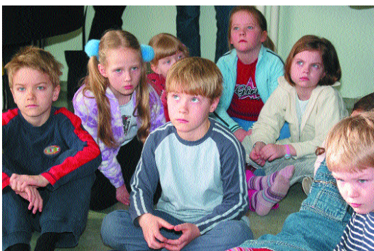
Hlustað á formann Hagsmunafélagsins, frá athöfn í Landakotsskóla