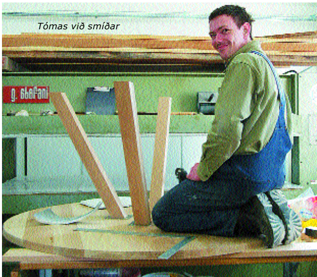
Tómas við smíðar