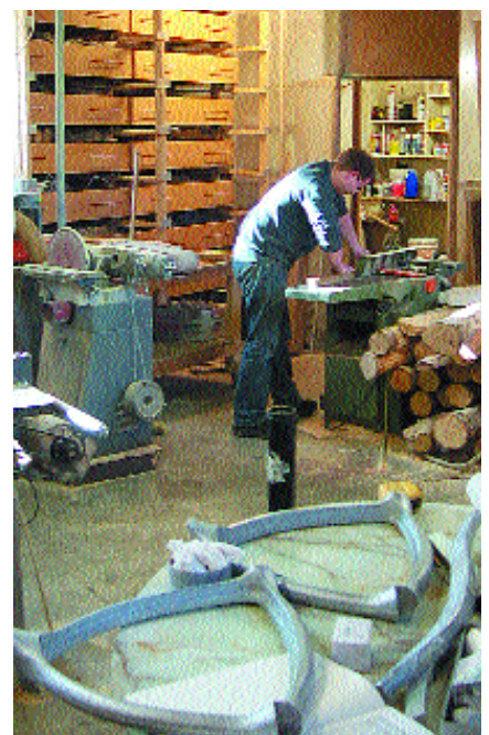
Í smíðju Fjölmis