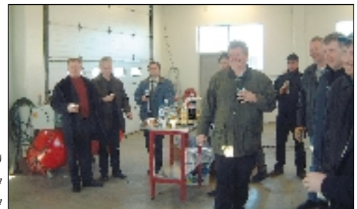
...kátir karlar að loknum venjulegum aðalfundarstörfum