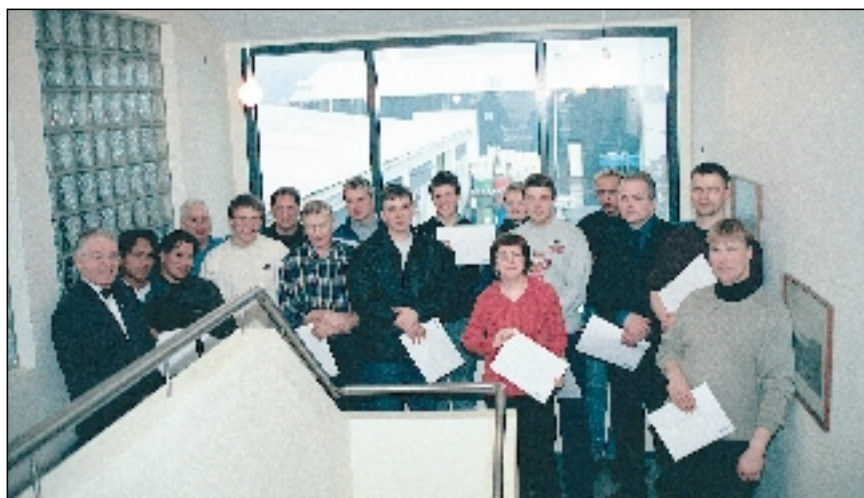
Ánægðir nemendur með viðurkenningarskjöl að námskeiði loknu