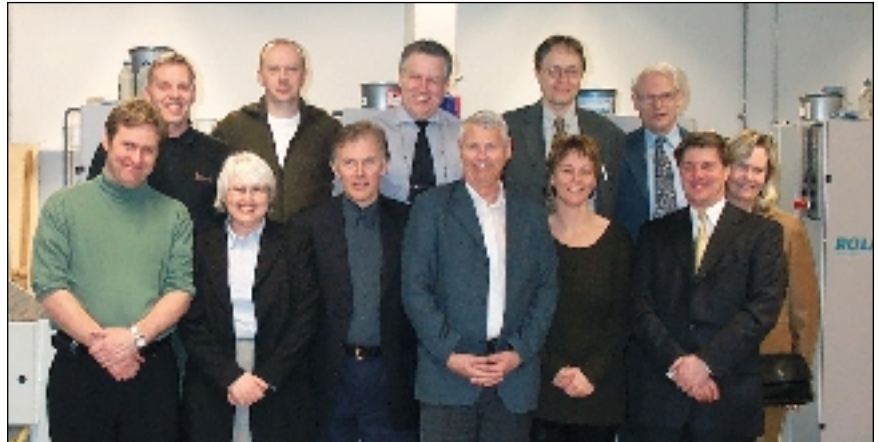
Í heimsókn Hjá Guðjóni Ó

Nokkrir fulltrúar frá samtökum norræna blaðaútgefenda og prentsmiðja voru hér á ferð í byrjun apríl. Samtök iðnaðarins skipulögðu heimsókn þeirra í tvö íslensk fyrirtæki í prentiðnaði og héldu fund með hópnum. Hinir erlendu gestir eru sérfræðingar í umhverfismálum og hafa þau á sinni könnu hjá samtökum sínum.