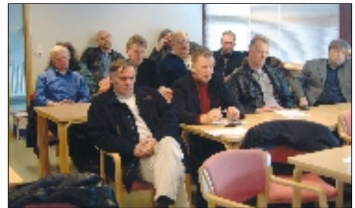
„Ferskir vindar blésu á fundinum“...