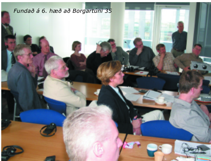
Fundað á 6. hæð að Borgartúni 35

sem er samstarfsverkefni Samtaka iðnaðarins, Samiðnar og Vinnueftirlitsins, hófst í febrúar í þremur fyrirtækjum í byggingariðnaði, þ.e. Ágústi og Flosa hf., ÍAV hf., Sveinbirni Sigurðssyni ehf. og þremur fyrirtækjum í málmíðnaði, Héðni hf., Slippstöðinni hf.