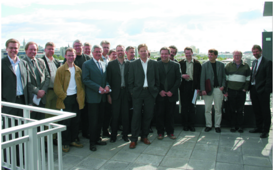
Glaðbeittur hópur fundarmanna að loknum stofnfundi