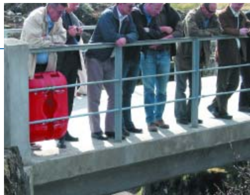
Norræni hópurinn fór á Þingvelli, Gullfoss og Geysi með góðum leiðsögumönnum