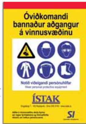
Sýnishorn af öryggisskilti fyrirtækis með beina aðild að SI

einnig að finna drög af slíkur kerfi í gæðakerfi SI.