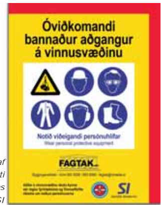
Sýnishorn af öryggisskilti félagsmanns í MIH og SI