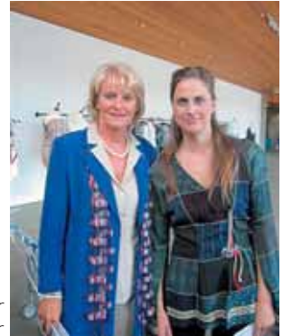
Iðnaðarráðherra Valgerður Sverrisdóttir og Guðbjörg Gissuraradóttir

„Íslensk hönnun; einstök útflutningsvara - stöðulýsing árið 2010. Skapandi atvinnugreinar eru viðurkenndar í hópi meginstöða íslensks efnahagslífs. Hönnun er sjálfstæð atvinnugrein sem getur starfað óháð staðbundinni framleiðslu. Íslensk sendiráð og verkefni erlendis endurspeglar íslenska hönnun og draga fram sérkenni hennar. Útflutningur á íslenskri hönnun hefur margfaldast á undanföllum árum og íslensk hönnun er orðin vel þekkt erlendis. Öflug íslensk hönnunar- og markaðsfyrirtæki hafa náð fótfestu á erlendum markaði með vörumerki sínu. Fjöldi íslenskra hönnuða er þekktur hver á sínu sviði á alþjóðlegum markaði. Íslensk hönnun hefur skilgreint og samræmt kennimark sem aðgreinir hana í erlendri markaðssetningu.“