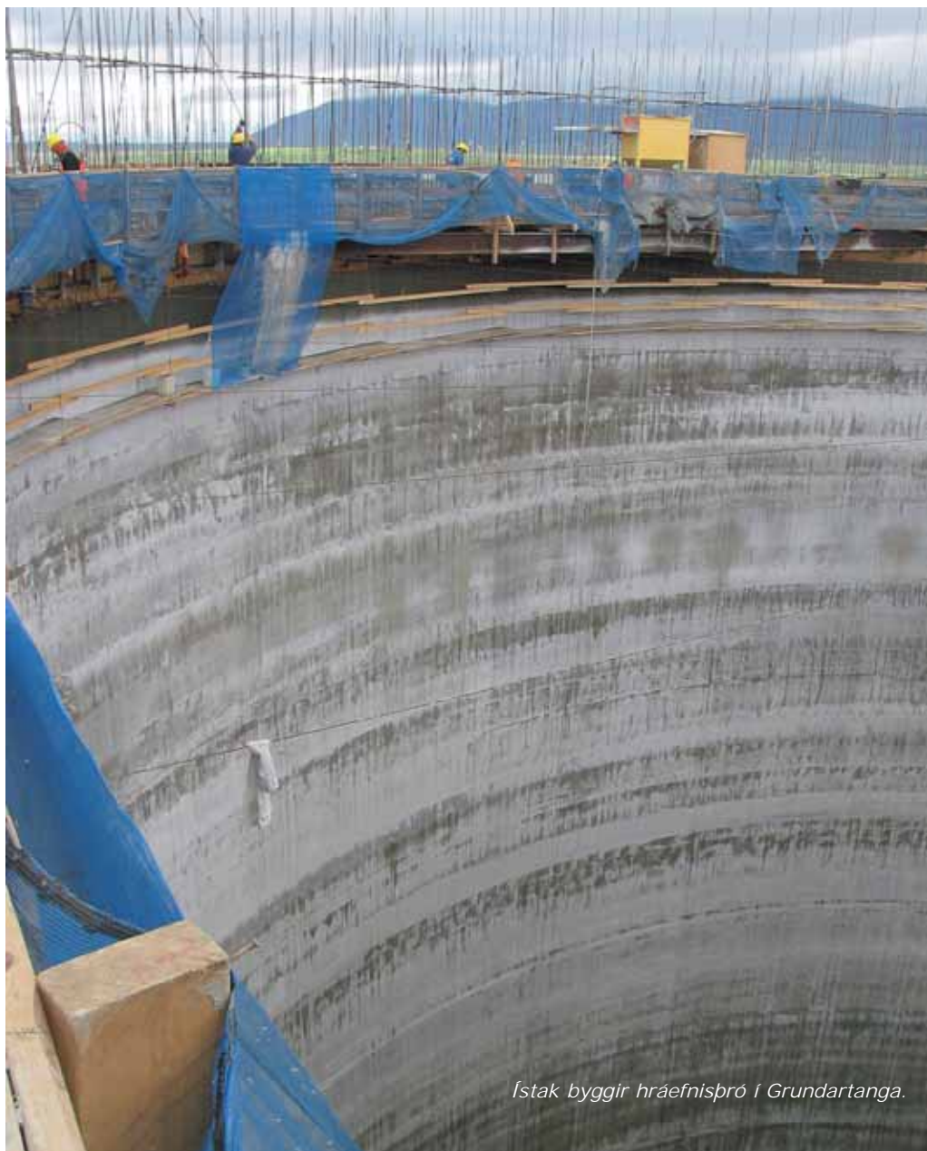
Ístak byggir hráefnisþró í Grundartanga.

Umsvif í bygginga- og verktakastarfsemi hafa aldrei verið meiri hér á landi en um þessar mundir. Tíðindamenn Samtaka iðnaðarins tóku hús á nokkrum félagsfyrirtækjum og spurðust fyrir um einstök verkefni og stöðu greinarinnar. Umfjöllun um byggingaiðnað bls. 2 - 13.