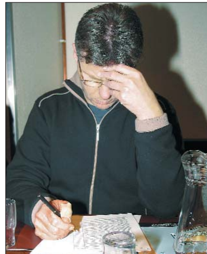
Hvað verður eftl á blaði?

Fundarmenn lögðu til 75 hugmyndir eða atriði sem þeir töldu vænleg til að gera þessa framtíðarsýn að veruleika. Þeir forgangsroðuðu hugmyndunum og má sjá 12 þær mikilvægustu í meðfylgjandi töflu.