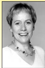
Reykjavíkurborg: Ingibjörg Sólrún Gísladóttir borgarstjóri