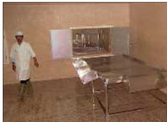
Náverandi vinnsla verður að teljast nokkuð frumstæð. Til marks um það er þessi flokkari í vinnslubúsi í Úganda