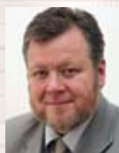
Össur Skarphéðinsson Ávarp iðnaðarráðherra