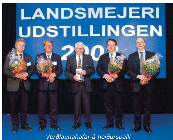
Verðlaunahafar á heiðurspalli

Dalabrie, þykkmjólk og biomjólk fengu sérstök heiðursgullverðlaun á sýningunni