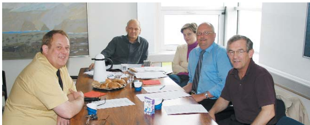
Úrsmiðir funda með starfsmönnum SI um gæðakerfi sitt

áður með tilkomu gæðakerfisins, er sú þjónusta sem SI veitir félögum. Nokkur þeirra hafa samið við skrifstofu SI um að sjá um innheimtu, bókhald og fjárhag en önnur annast slíkt að sumu eða öllu leyti sjálf. Lögd er áhersla á að ganga frá samningum við sérhvert félag og skilgreina það verklag sem samstarfið og þjónustan byggjast á. Ætlunin er að birta gæðakerfi þessara félaga á vefsetri SI nú í haust og þá ættu innviðir og starfsemi félaganna að verða mun sýnilegri og upplýsingar um félögin aðgengilegri fyrir félagsmenn en áður.