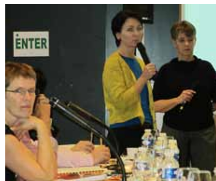
Íslensku keppendurnir kynna Íslandus

Önnur verðlaun hlaut þýska liðið fyrir pakka með tilbúnum hráefnum í eplaköku með strádeigi sem unnin eru á nýstárlegan hátt með háþrýstimeðferð og í þriðja sæti varð lið Frakklands fyrir fljótandi eggjablöndu sem breytir afgangsbrauði í dýrindis brauðbúðing.