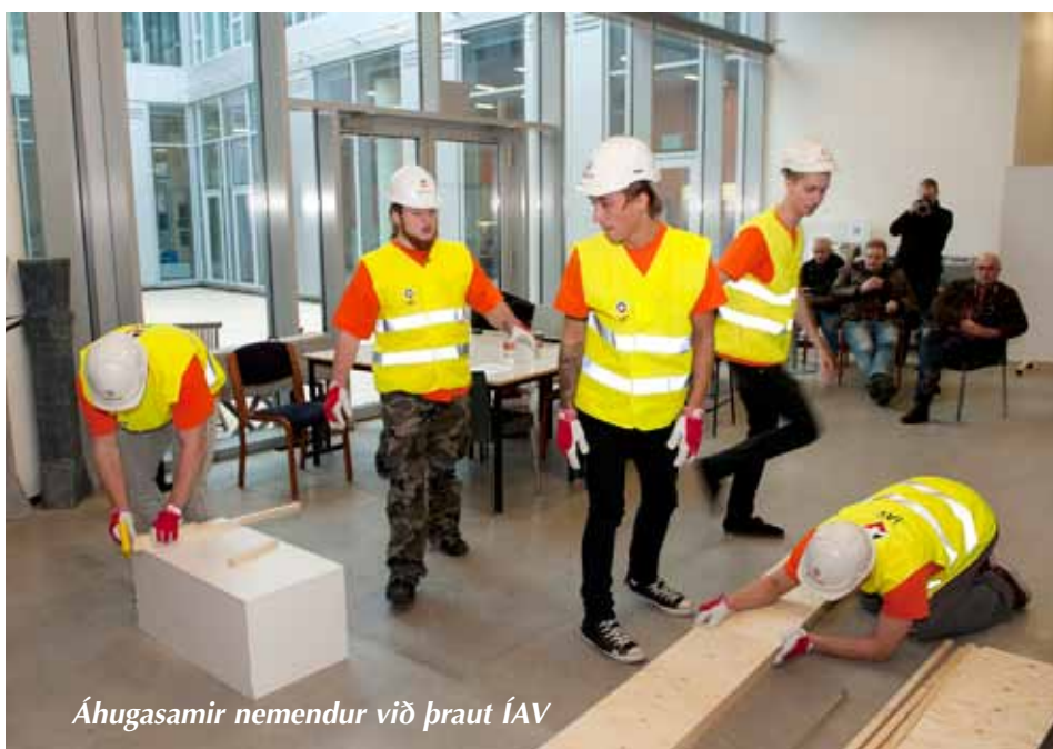
Áhugasamir nemendur við þraut ÍAV