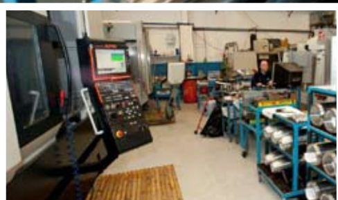
Yfirsýn yfir hluta Vélvíkur og skrokka utan um sjálfstýrða kaafbáta

Vélvíkur smíðað fullkomin verkfæri, mót og stansa auk stálherslu og skönnun hluta. Allt er þetta unnið með undrahraða og af mikilli nákvæmni.