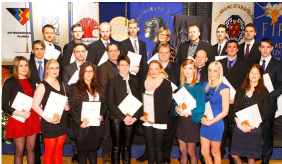
Föngulegur hópur nýsveina

Iðnaðarmannafélagið í Reykjavík hélt sjöttu verðlaunahátíð sína til heiðurs 23 nýsveinum sem luku burtfararprófi í iðngreinum með afburðaárangri 2011. Hátíðin var í Tjarnarsal Ráðhússins í Reykjavík laugardaginn 4. febrúar.