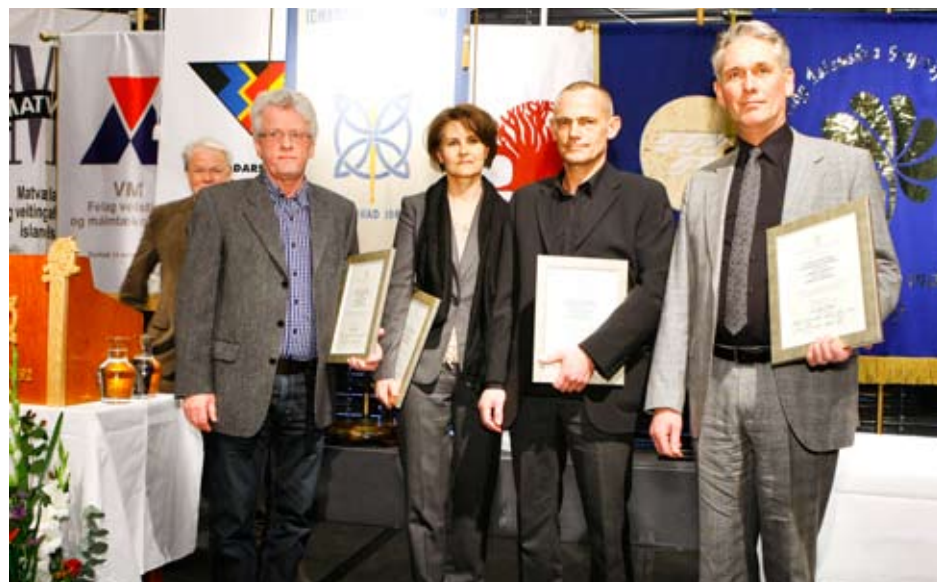
Hönnuðir og framleiðandi ársins - fyrirtækin GO Form Design Studio og Brúnás Innréttingar