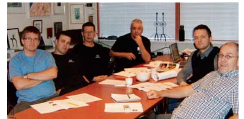
Efri mynd starfsmenn Odda, neðri frá vinstri Prenttækni og Umslag