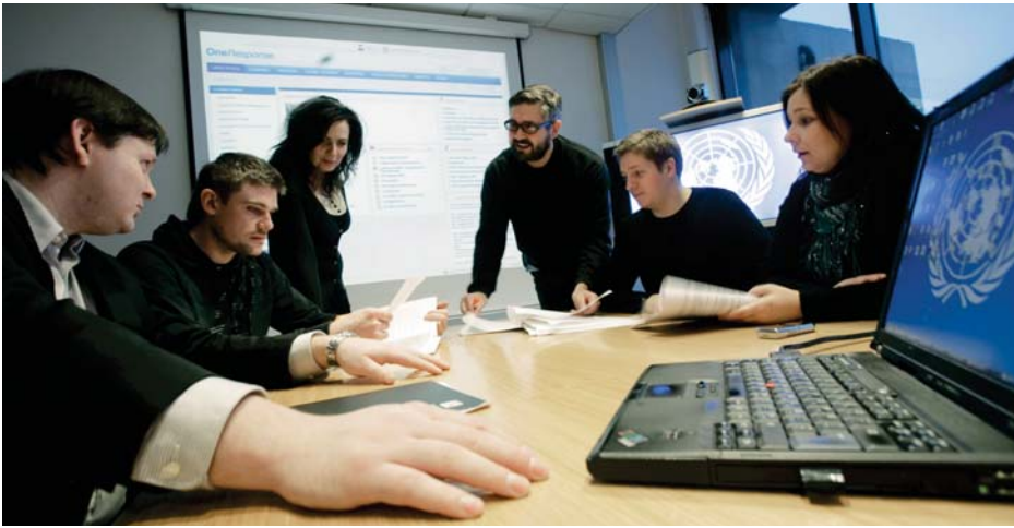
MS Sharepoint teymi hjá TM Software verðlaunað af Microsoft fyrir þróun OneResponse