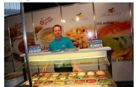
Hollt og gott