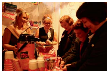
Kaffitár í jólasþapi