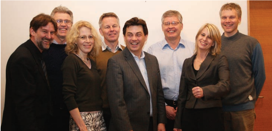
Samhent og virk stjórn SSP einróma endurkjörin á aðalfundi SSP

A ðalfundur sprotafyrirtækja var haldinn 10. desember í húsakynnum Fjölbendis ehf. í Hafnarfirði. Formaður og aðrir stjórnarmenn gáfu allir kost á sér til áframhaldandi setu og var stjórnin einróma endurkjörin.