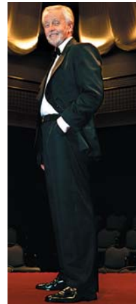
Sumarið 2005 tóku sex Tískuteymi-SI sex þjóðþekktu Íslendinga í heildræna meðferð í samvinnu við Morgunblaðið, og var útkoman glæsileg í alla staði.