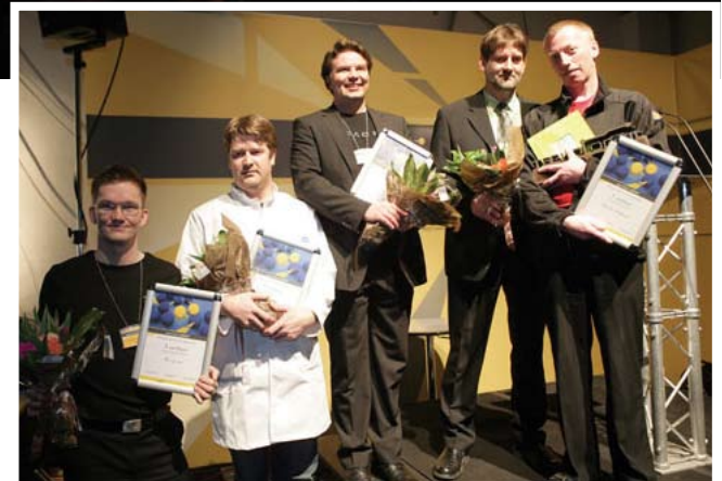
Vinningshafar á Tækni og viti með viðkenningar- skjöl sín

Sýningarsvæði SI, Sprotatorg , var valið það athyglisverðasta á sýningunni Tækni og viti 2007, sem haldin var í Fífunni 8. til 11. mars. Jafnframt var tilkynnt að rafræn skilríki á vegum Auðkennis í samvinnu við fjármálaráðuneytið væri athyglisverðasta varan.