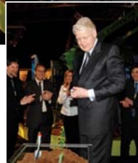
Forsetinn við gróðursetningu sprota

Fjölmargir viðburðir voru haldnir í tengslum við Tækni og vit 2007. Þar má nefna UT-daginn sem haldinn var á vegum forsætis- og fjármálaráðuneytis 8. mars. Einnig héldu Samtök iðnaðarins athyglisverða ráðstefnu 9. mars um samskipti frumkvöðla og fjárfesta auk þess sem Vaxtarsprotinn 2007 var veittur við hátíðlega athöfn. Fyrirtækið Marorka ehf. hlaut Vaxtarsprotann sem er viðurkenning á vegum Samtaka iðnaðarins, Rannsóknamiðstöðvar Íslands og Háskólans í