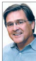
Þorsteinn Pálsson, ritstjóri Fréttablaðsins