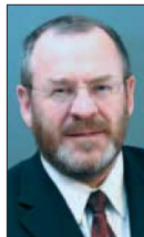
Jón Sigurðsson, iðnaðar- og viðskipta- ráðherra