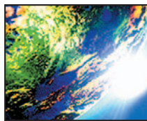
Ráðstefna Alpjódámálastofnunar HÍ.

„Ég tel að það sé afar mikilvægt að við áttum okkur á því að Ísland hefur tekið stór skref í Evrópusamrunanum - skref sem hafa haft mikil og margvísleg áhrif á íslenskt samfélag. Kjósi Ísland í framtíðinni að gerast aðili að Evrópusambandinu tel ég að slíkt skref, án þess að gera lítið