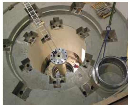
Stirnir á stálið í undirstöðum einnar aflvélarinnar