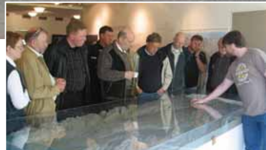
Módel af framkvæmdunum skoðað í Végardí

Í fyrstu var komið við í upplýsingamiðstöðinni í Végardí þar sem gerð er ítarleg og góð grein fyrir þessum miklu framkvæmdum. Því næst var ekið upp að Kárahnjúkastíflunni og þar fundu menn mjög til smæðar sinnar enda eiga framkvæmdir þar engan sinn líka hér á