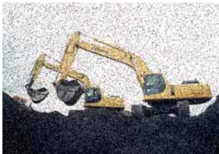
Samvinna er rétta leiðin