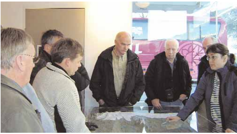
Fulltrúi Landsvirkjunnar útskýrir forsendur og legu Kárahnjúkavirkjunnar