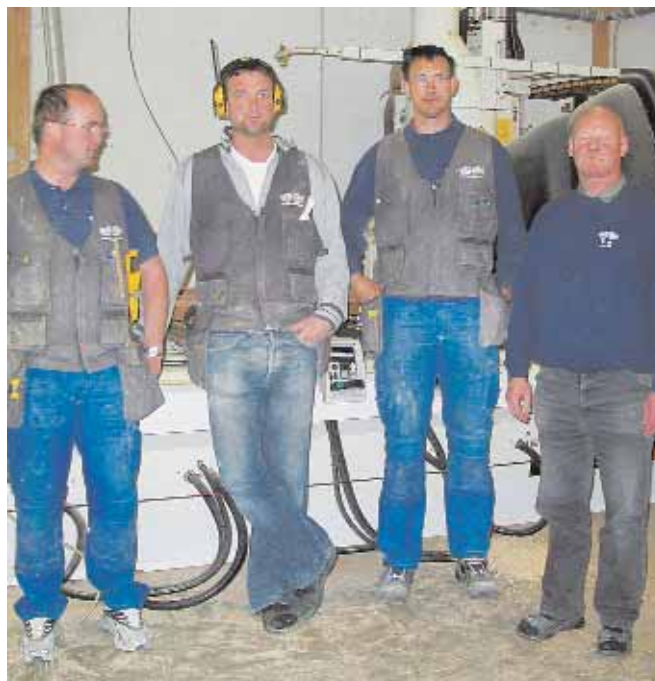
Eigendur við yfirfræsarann góða