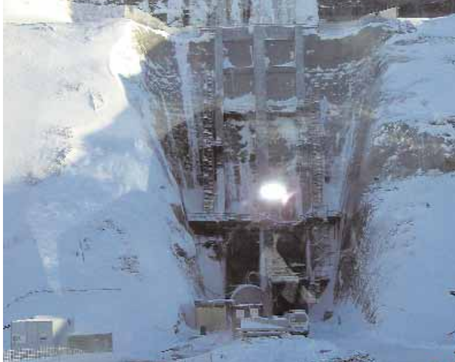
Inntaksmannvirki í Kárahnjúkum