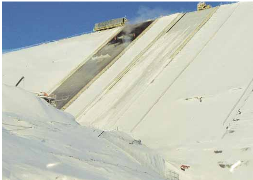
Steypt þekja á innanverðan stíflugarðinn