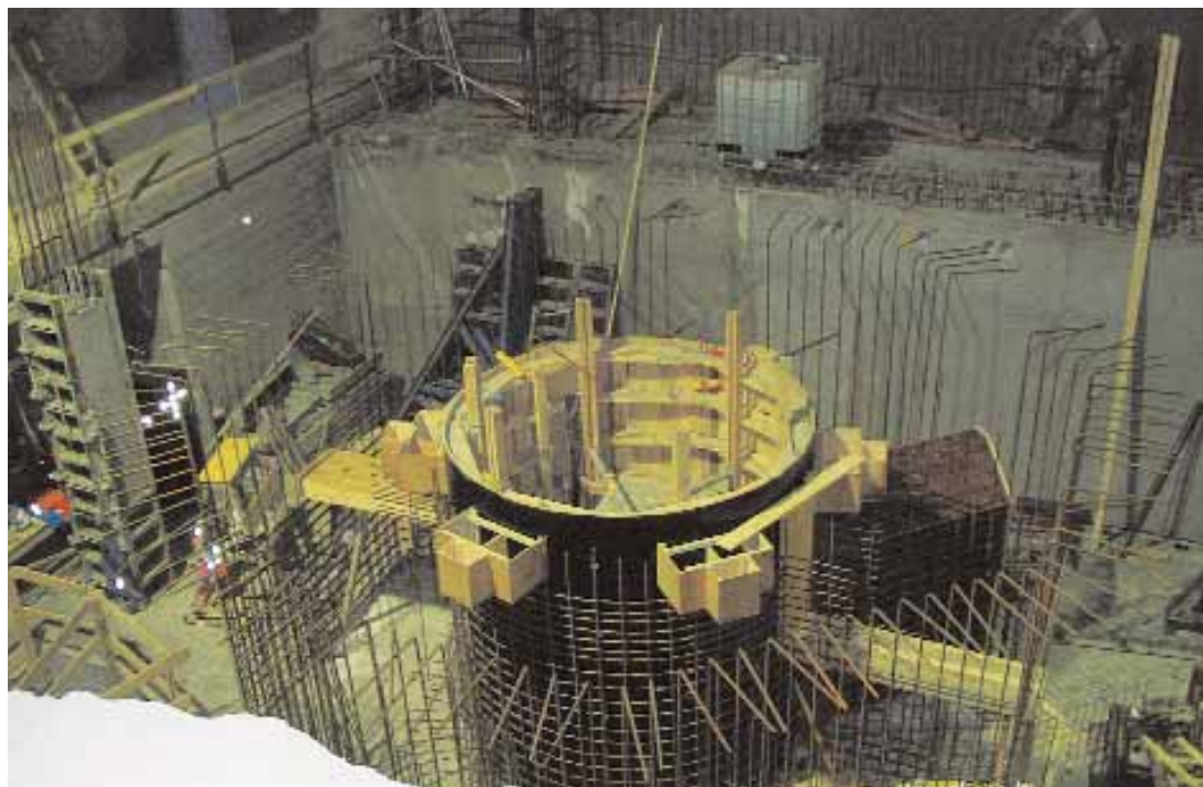
Undirstöður túrbínunnar eru merk mannvirki