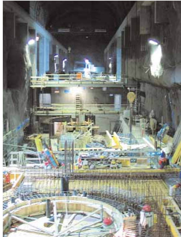
Stöðvarhús virkjunarinnar í Fljótsdal