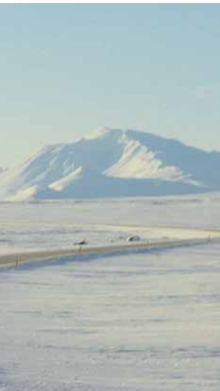
Snæfell skartaði sínu fegursta