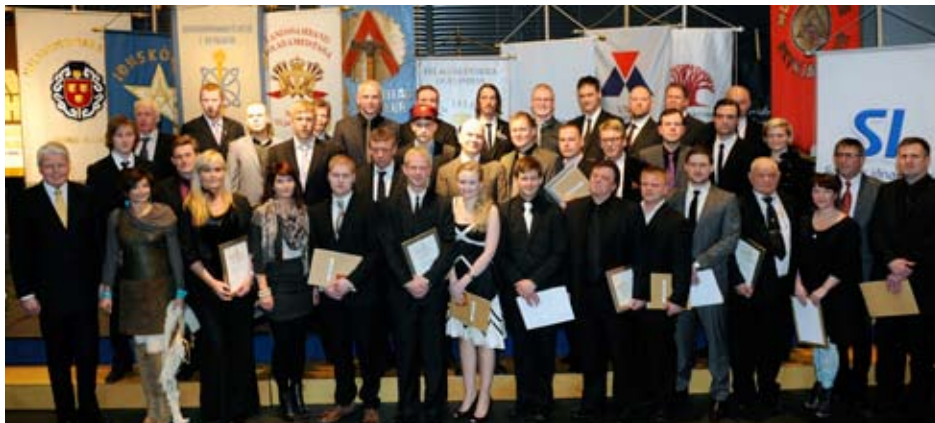
Föngulegur hópur nýsveina með forsetahjónunum

Verðlaunahátíð Iðnaðarmannafélagsins í Reykjavík til heiðurs iðngreinunum og nýsveinum sem lokið hafa sveinsprófi með afburðaárangri fór fram í Tjarnarsal Ráðhúss Reykjavíkur laugardaginn 5. febrúar að viðstöddu fjölmenni auk forseta Íslands, ráðherrum mennta og iðnaðar og borgarstjóranum í Reykjavík.