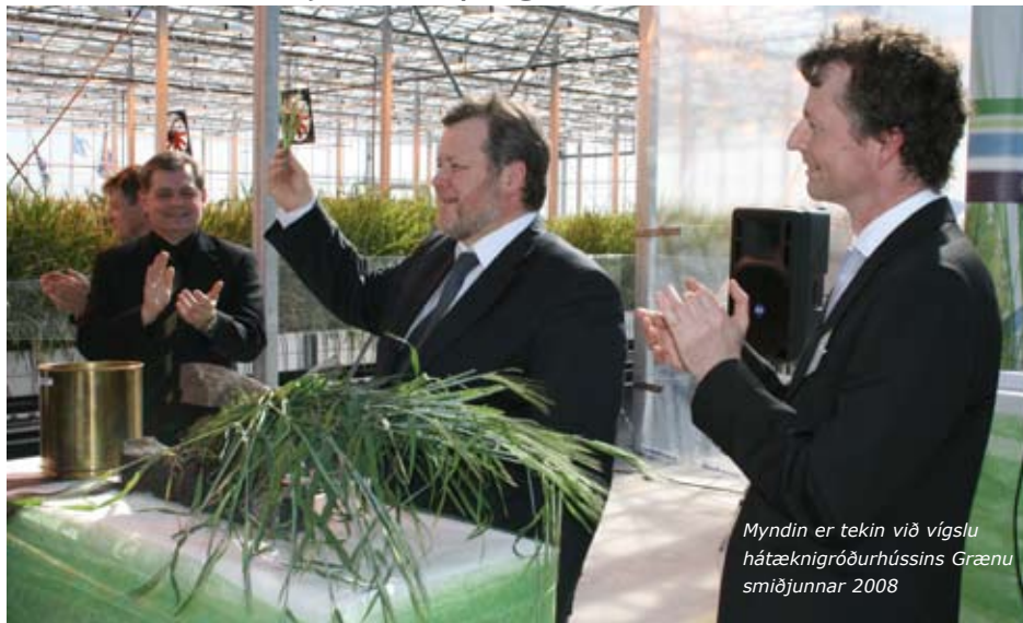
Myndin er tekin við víslu hátæknigróðurhússins Grænu smiðjunnar 2008

Kaldar kveðjur frá alþingismönnum á afmælinu