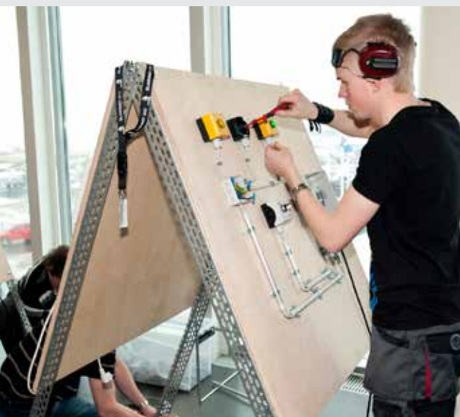
Íslandsmót iðn- og verkgreina í HR 2012

Íslandsmót iðn- og verkgreina verður haldið dagana 6. – 8. mars í Kórnum í Kópavogi. Þar keppa nemendur í iðn- og verkgreinaskólum landsins í ýmsum iðngreinum auk þess sem skólarnir kynna starfsemi sína. Íslandsmótinu er stýrt af Verkiðn, sem samanstendur af 15 fagfélögum og Iðnmennt. Fagfélögin sjá um framkvæmd og fjármögnun keppnisgreinanna og MMR er stærsti styrktaraðili Verkiðnar.