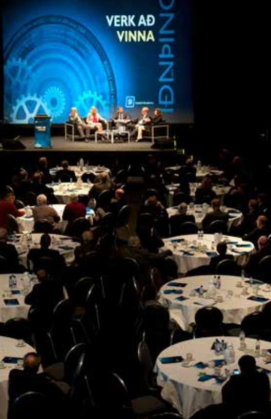
Iðning 2012 í Íþrótt- og sýningarhöllinni í Laugardal