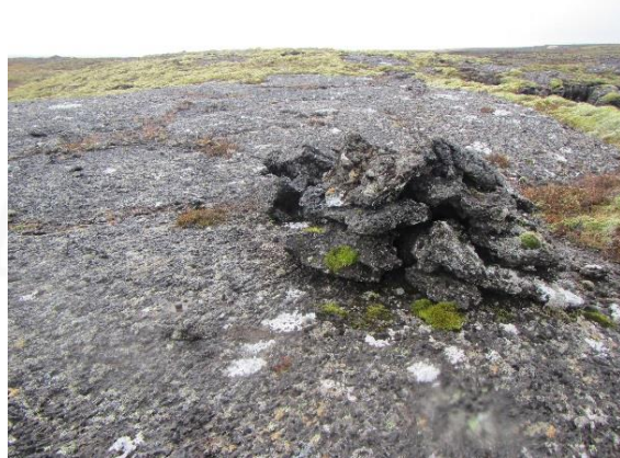
Mynd 10. Landmælingapunkturinn og varða 057 skammt austan hans.

Varðan er 0,8 m í þvermál og grjóthlaðin. Hún er 0,3 m á hæð og má greina 3 umför hraungrýtis í henni.