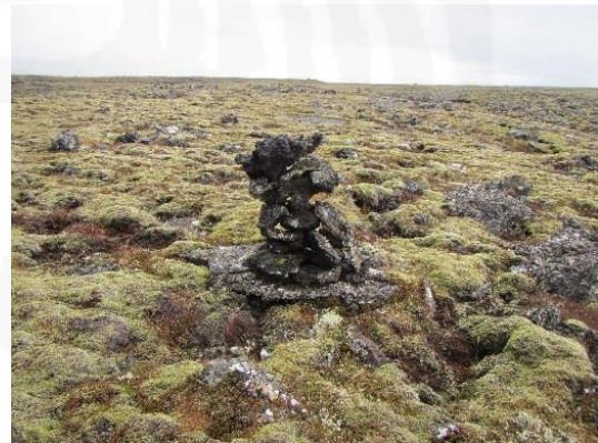
Mynd 6. Varða 053, horft til ASA.