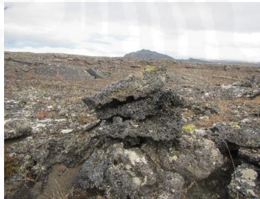
Mynd 11. Varða 058, horft til ANA.