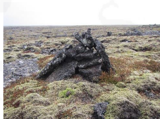
Mynd 7. Varða 054, horft til austurs.