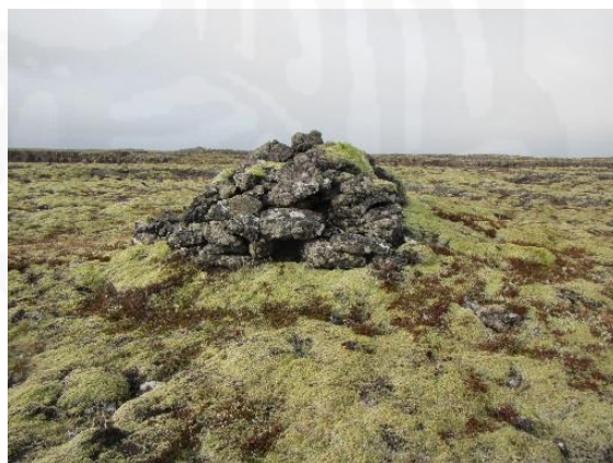
Mynd 9. Varða 056, horft til suðvesturs og vesturs.

vörðunni er ruddur vegslóði í hrauninu. Varðan er á deiliskipulagssvæðinu, innan reits 4.