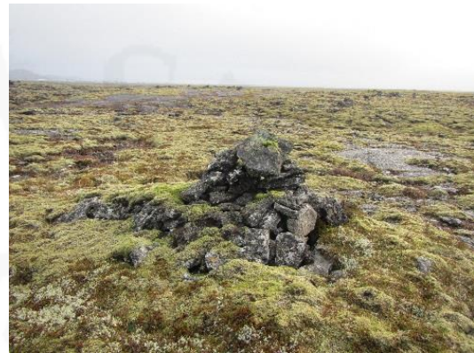
Mynd 5. Varða 052, horft til austurs.