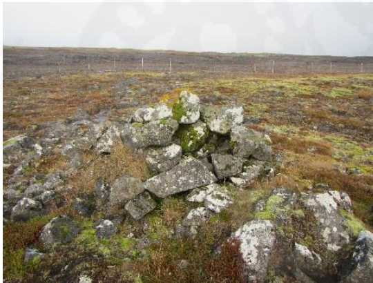
Mynd 3. Varða 050, horft til norðvesturs.

Varða er 280 m vestan við Sundvörðu 007 og 70 m sunnan við vörðu 051. Um 20 m til vesturs frá vörðunni er gaddavírsgirðing umhverfis golfvöll Grindavíkur, Húsatóftavöll. Varðan er 50 m vestan við reit 1, rétt utan deiliskipulagssvæðis og hlutverk hennar er óþekkt.