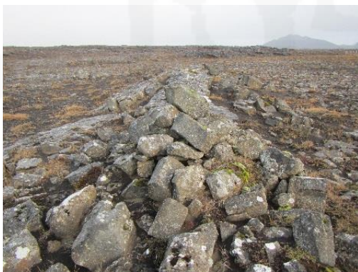
Mynd 4. Varða 051, horft til norðurs.

Varða er á hraunhrygg um 430 m suðvestan við vörðu 057 og 300 m norðvestan við Sundvörðu 007. Varðan er tæpum 40 m vestan við reit 1, rétt utan deiliskipulagssvæðis og hlutverk hennar er óþekkt.