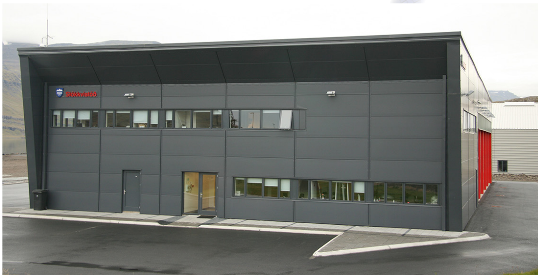
Slökkvistöðin á Eskifirði.

gerð reglugerðarinnar þarft skref í þá átt að styrkja starfsemi slökkviliða og lítur sambandið svo á að um sé ræða mikilvægt samstarfsverkefni sveitarfélaga, slökkviliða og ríkisins. Út frá faglegum sjónarmiðum eru ákvæði reglugerðarinnar að mati sambandsins að flestu leyti jákvæð og til þess fallin að styrkja starfsemi slökkviliða. Hins vegar eru gerðar nokkrar athugasemdir. Þrjár helstu athugasemdirnar lúta að fjölda eldvarnarefirlitsmanna (12.