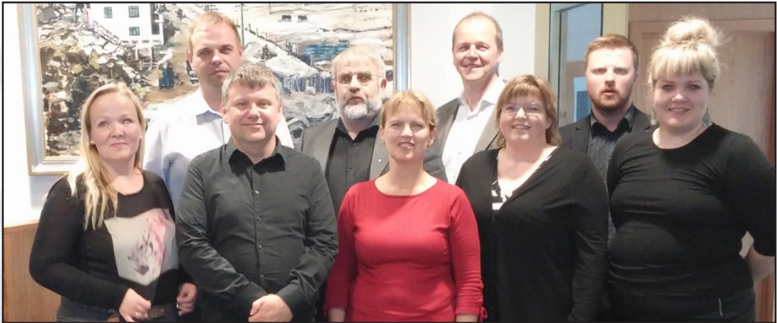
Sveitarstjórn Borgarbyggðar 2014-2018, myndin er af vef Borgarbyggðar.