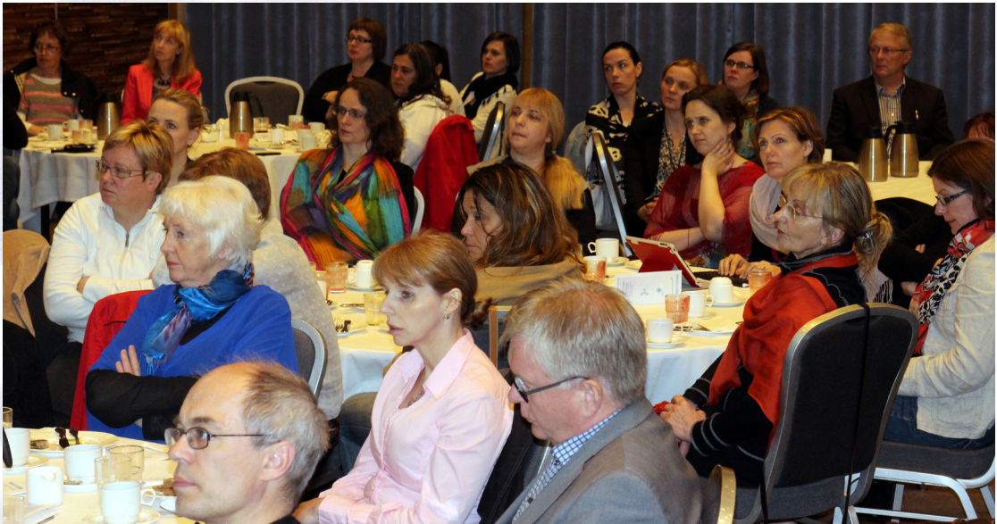
Frá morgunverðarfundinum sem haldinn var 13. júní sl.