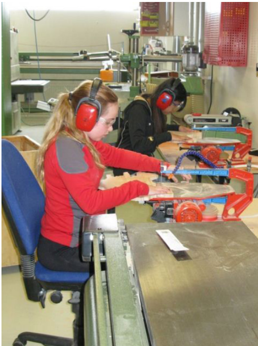
Frá Verkmenntaskóla Austurlands.

Samband íslenskra sveitarfélaga vekur athygli á áhugaverðri nýng í kynningu á verknámi sem Verkmenntaskóli Austurlands og Vinnuskóli Fjarðabyggðar hleyptu af stokkunum í sumarbyrjun. Allir þeir sem luku 9. bekk grunnskóla í Fjarðabyggð í vor og skráðir eru í Vinnuskóla Fjarðabyggðar hófu