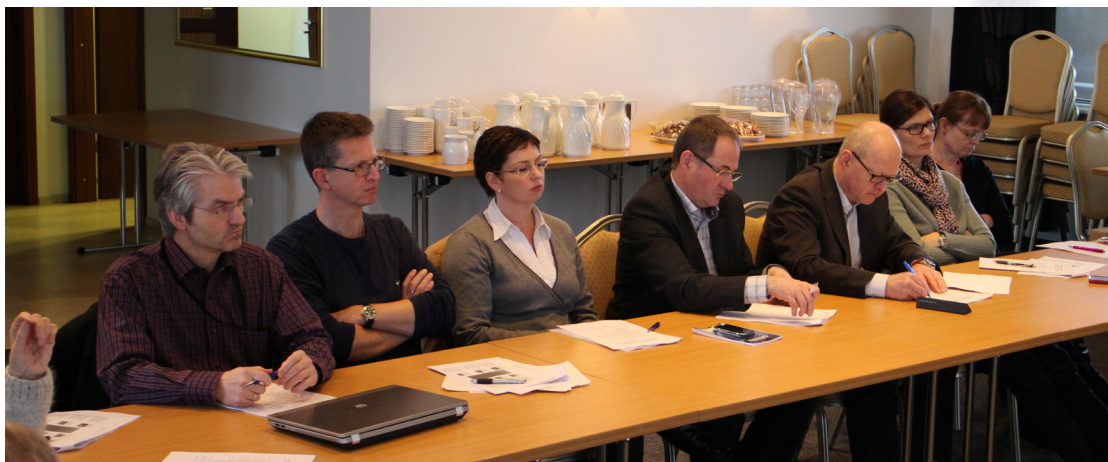
Frá fundi um upplýsingasamfélagið sem haldinn var í febrúar sl.

Samstarf ríkis og sveitarfélaga um framþróun upplýsingasamfélagsins hefur aukist undanfarin ár sem er mjög jákvætt. Til að unnt sé nota upplýsingatækni til að bæta opinbera þjónustu og hagræða í rekstri þurfa rafræn gögn að geta flætt óhindrað á milli stofnana ríkis og sveitarfélaga og það kallar á samstarf á milli stjórnsýslustiganna. Framþróun upplýsingasamfélagsins krefst fjárfestinga í upphafi sem skila munu hagræðingu til lengri tíma lítið. Það sparar opinbert fé að ríki og sveitarfélög hafi