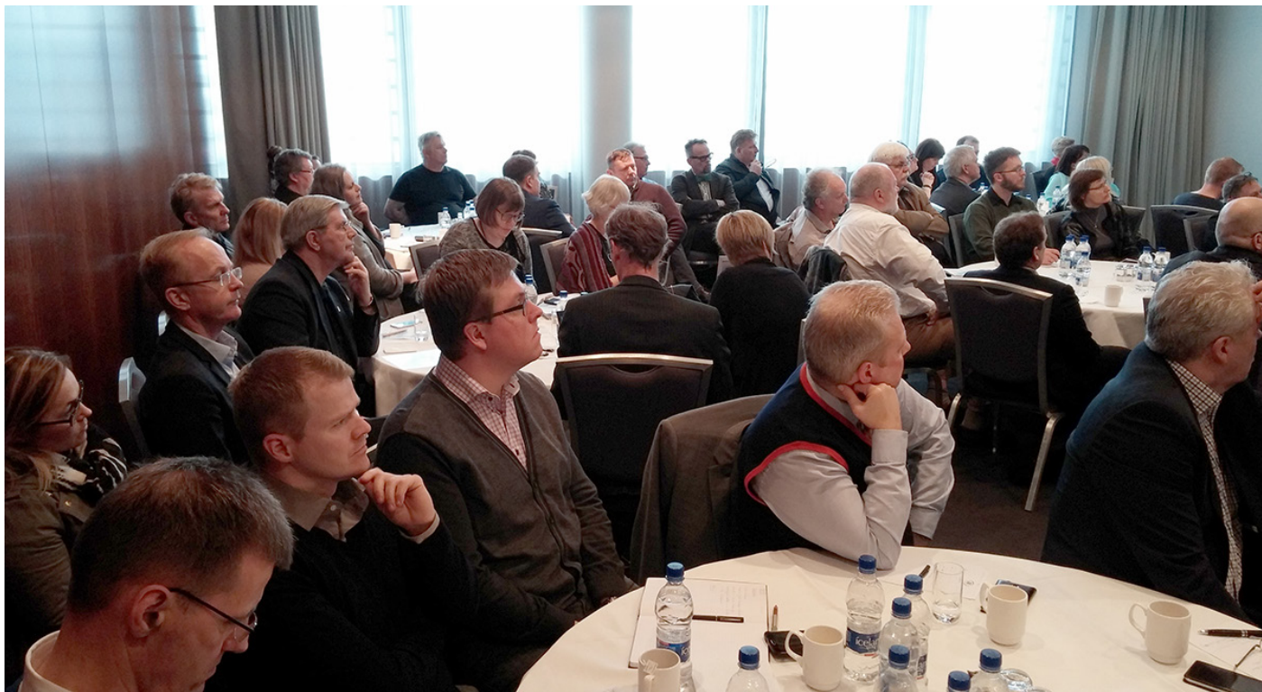
Frá ráðstefnu um meðhöndlun úrgangs sem haldin var á Hilton Reykjavík Nordica 19. mars sl.