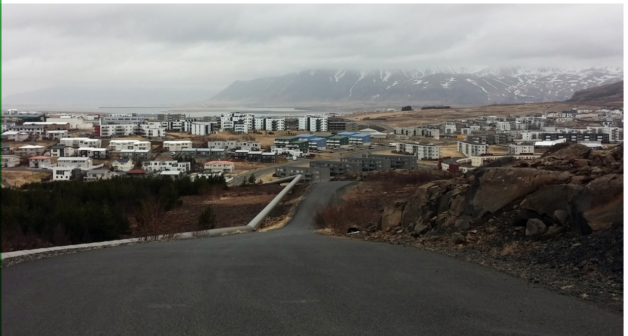
Horft til norðurs yfir Grafarholt í Reykjavík.

Þá vísar nefndin til þess að í samþykkt um meðhöndlun úrgangs í Reykjavíkurborg segi að borgin sjái um söfnun á blönduðum heimilisúrgangi frá íbúðarhúsum og hafi umsjón með rekstri grenndarstöðva fyrir flokkaðan heimilisúrgang. Einnig vísar borgin til þess að sorphirðugjald er ákvarðað sem jafnaðargjald á hverja gjaldskylda fasteign. Borginni hafi því verið heimilt að ákveða að tiltekið fast gjald skyldi lagt á fasteign kæranda enda þurfi að lágmarki að vera eitt sorpílát fyrir blandaðan heimilisúrgang við hvert íbúðarhús. Kröfu kærða um ógildingu hinnar kærðu ákvörðunar var því hafnað.